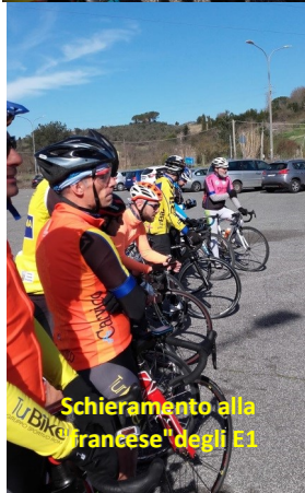
Schieramento alla francese degli E1