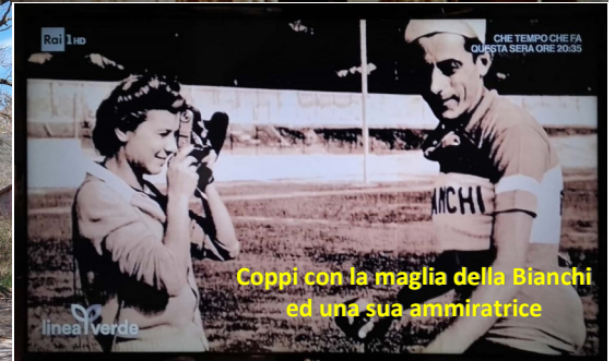
Coppi con la maglia della Bianchi ed una sua ammiratrice