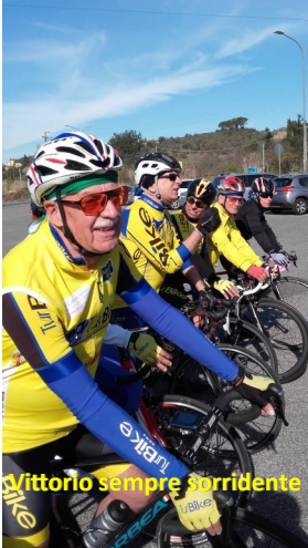
Victorio sempre sorridente