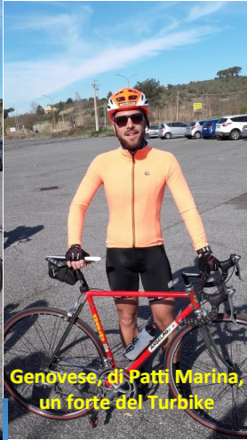
Genovese, di Patti Marina, un forte del Turbike