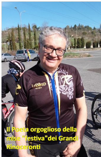
Il Poeta orgoglioso della mise "festiva" dei Grandi Rinoceronti