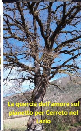
La quercia dell'amore sul pianetto per Cerreto nel Lazio