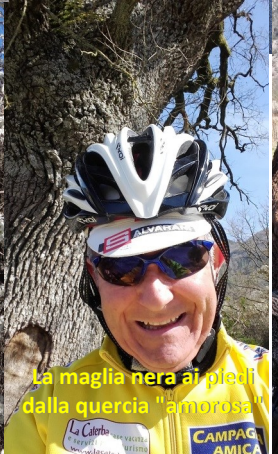
La maglia nera ai piedi dalla quercia "amorosa"