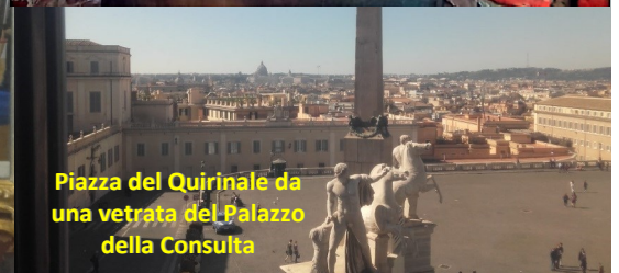
Piazza del Quirinale da una vetrata del Palazzo della Consulta