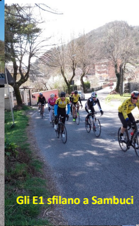
Gli E1 sfilano a Sambuci