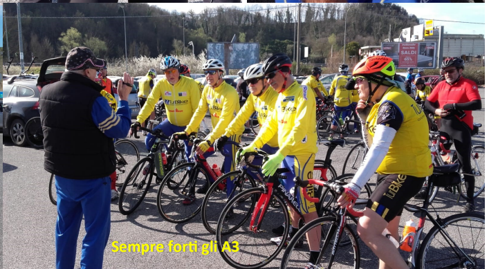
Sempre forti gli A3