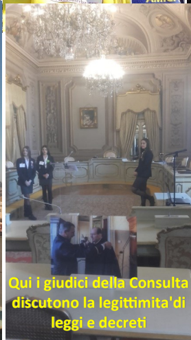
Qui i giudici della Consulta discutono la legittimità di leggi e decreti