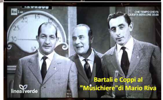
Bartali e Coppi al "Musicchiere" di Mario Riva