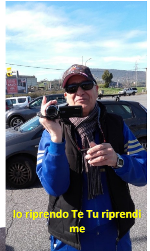
Io riprendo Te Tu riprendi me