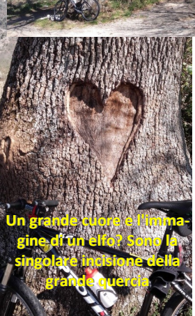
Un grande cuore e l'immagine di un elfo? Sono la singolare incisione della grande quercia