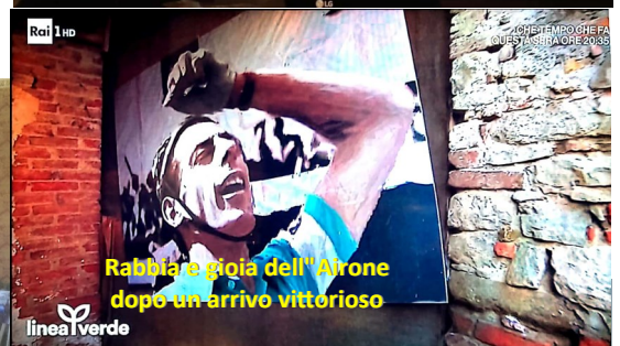
Rabbia e gioia dell'Airone dopo un arrivo vittorioso