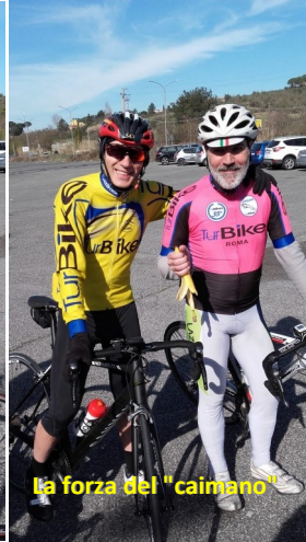
La forza del "caimano"