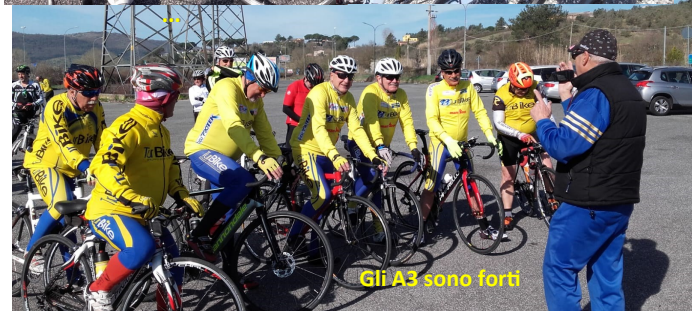
Gli A3 sono forti