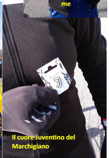
Il cuore Juventino del Marchigiano