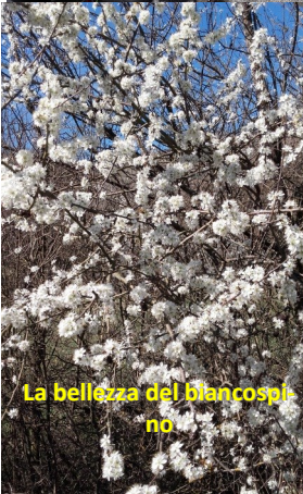
La bellezza del biancospino