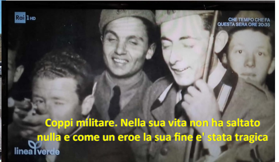
Coppi militare. Nella sua vita non ha saltato nulla e come un eroe la sua fine e' stata tragica