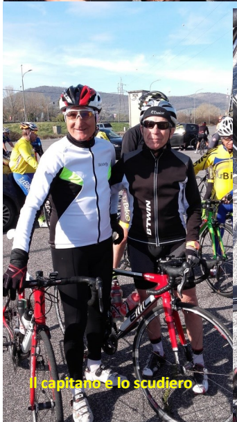
Il capitano e lo scudiero